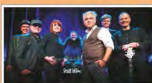
STILL COLLINS Fr. 28.4. 20 Uhr