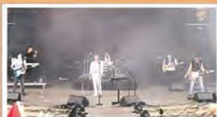
MYSTERY Do. 13.4. 20 Uhr