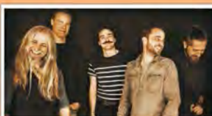
LAZULI Di. 2.5. 20 Uhr