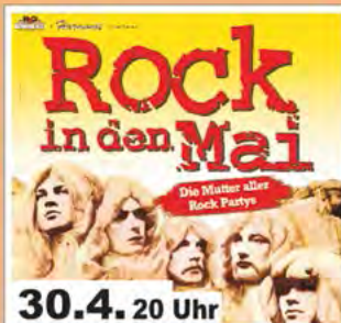
30.4. 20 Uhr