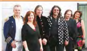
ELO Tribute by Phil Bates Do. 30.3. 20 Uhr