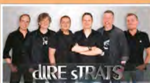
DIRE STRATS Fr/Sa. 21/22.4. 20 Uhr