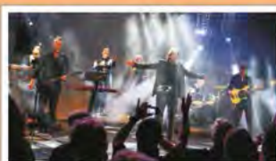
RPWL Fr. 31.3. 20 Uhr