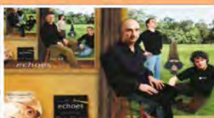
echoes Fr. 14.4. 20 Uhr