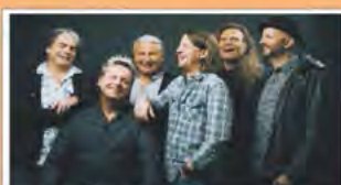
BLÄCK FÖÖSS Mo. 17.4. 20 Uhr