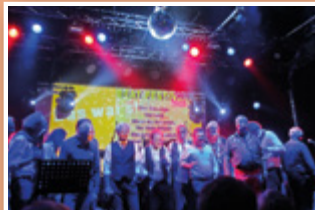
BONN BEAT FESTIVAL Sa. 06. Oktober 20:00 Uhr