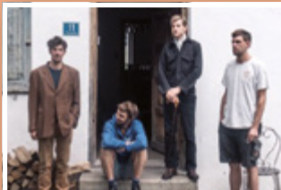
KOFELGSCHROA Mi. 28. November 20:00 Uhr