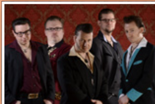
FOGGY MOUNTAIN ROCKERS Sa. 01. Dezember 20:00 Uhr