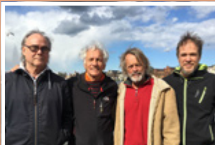
GURU GURU Do. 29. November 20:00 Uhr