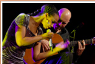
FRIENDS 'N' FELLOW Do. 08. November 20:00 Uhr